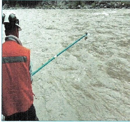
Fotografía 1: Punto de Muestreo